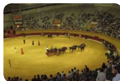
Andalucía Cabalga en Atarfe 26 julio 2009

El 26 de julio y dentro de las fiestas de Atarfe por su Patrona Santa Ana, se celebró un espectáculo ecuestre a beneficio de Proyecto Hombre. El Ayuntamiento nos entregó el taquillaje completo de su Coliseo para que fuera vendido por nuestros voluntarios. Fue un éxito de público, más de 4.000 asistentes, y un éxito de los caballistas que intervinieron con su arte y su dominio de la doma del caballo. Agradecemos a la Corporación municipal y a su alcalde su ayuda desinteresada.