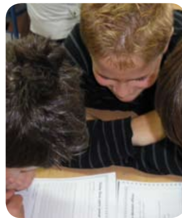
Programa 'Joven donde van tus manos'