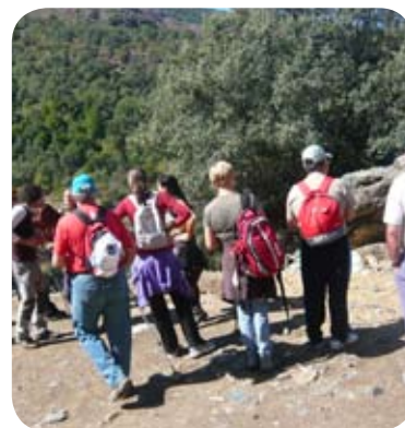
Taller de senderismo

y la Fuente de las Atajuelas. En el parque natural de Sierra Nevada han estado en la Hoya de la Mora y la Laguna de las Yeguas y en el municipio de Viznar han conocido la Cueva del Agua y el Sanatorio de la Alfaguara. Por delante tienen muchos kilómetros y nuevas rutas con el fin de prepararse para recorrer el Camino de Santiago con el que culmina este taller que por tercer año ha puesto en marcha a usuarios, familias y voluntarios.