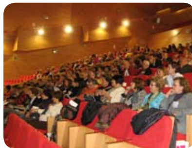
Voluntarios asistentes al Encuentro

Le diría que pruebe, damos una formación y estoy seguro de que encontrará su forma de colaboración. Tenemos un voluntariado amplio y fiel que testimonia que todo el que quiere hacer algo encuentra su sitio.