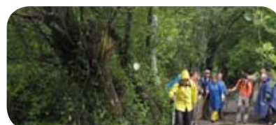
Camino de Santiago 2009

Un año más, 19 personas, entre usuarios, terapeutas y voluntarios de nuestro PH, peregrinaron a Santiago de Compostela, durante la días 6 al 13 de junio, haciendo a pie 125 kilómetros. Después se desplazaron hasta Finisterre en una excursión maravillosa. Agradecemos a la Fundación Ebro-Puleva la financiación de la peregrinación y al MADOC de Granada su inestimable ayuda logística.