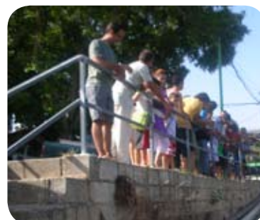
Comunidad Terapéutica visita Riofrío

este municipio el pasado 5 de agosto. Recorrieron el curso de las aguas que la alimentan e incluso se bañaron en la piscina de un vecino de este municipio que ejerció de anfitrión de este grupo de 28 miembros de Proyecto Hombre que pasaron un día muy especial en este bello entorno natural.