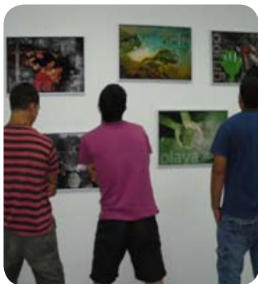
Programa 'Entre todos'

N o es fácil la tarea de acompañar a los usuarios en su viaje de vuelta a casa, donde la calma vuelve a reinar y todo se coloca de nuevo tras un largo y duro “desmontarse” y volver a construirse nuevamente como persona. Quizá por eso, al ver a tantas personas que “desmontan” su vida, nace el concepto de la prevención.