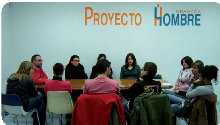
Formación para alumnos en prácticas

También queremos explorar nuevas perspectivas. Para ello pretendemos incorporar alumnos de diferentes formaciones (Máster en Intervención Social, Practicum de Psicología y de Trabajo Social...) en las áreas de Investigación, Innovación y Difusión del programa, para mejorar y hacer visible nuestro trabajo. Siguen existiendo muchas leyendas en torno al funcionamiento de los centros de tratamiento de adicciones y es una responsabilidad de todos los implicados aclarar esos mitos y demostrar que, con el trabajo diario y la ilusión correspondiente, el problema de la droga tiene solución. Y nosotros, en Proyecto Hombre, queremos ofrecer nuestra solución. Nuestra Esperanza para todos los que la necesiten.