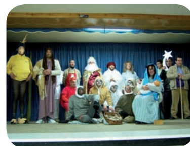
Fiesta Navidad 2008 bajos San Miguel Zaidín

El pasado año culminó con nuestra Fiesta de Navidad en los salones que nos cedió la Parroquia de San Miguel del Zaidín. Usuarios, familiares, terapeutas y voluntarios de Granada y Motril, después de celebrar la Eucaristía tuvimos un momento de fiesta, donde los usuarios de cada fase del programa nos ofrecieron diversas actuaciones llenas de ingenio y humor. A continuación, compartimos la comida y pasamos unas horas de convivencia inolvidables.