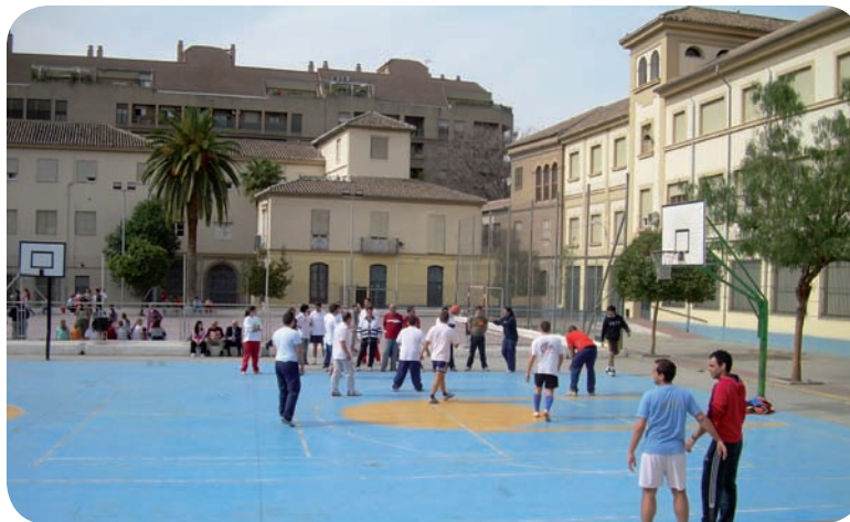
XV Jornada. Métele un gol a la droga