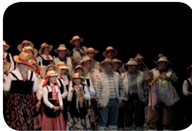
Algunos de los intervinientes