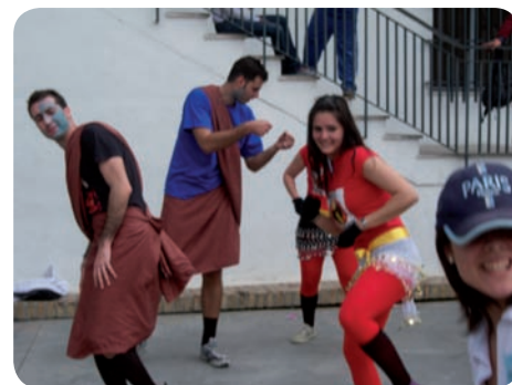
Animación de calle

Terminamos diciendo que merece la pena dedicar parte de nuestro valioso tiempo a personas que también son valiosas. Y pensamos que son valiosas porque por suerte o por desgracia han tropezado con este gran problema que es el mundo de la droga con todas sus consecuencias. Y puesto que son jóvenes, necesitan de manos solidarias que les ayuden a levantarse y a seguir caminando en busca de un futuro mejor.