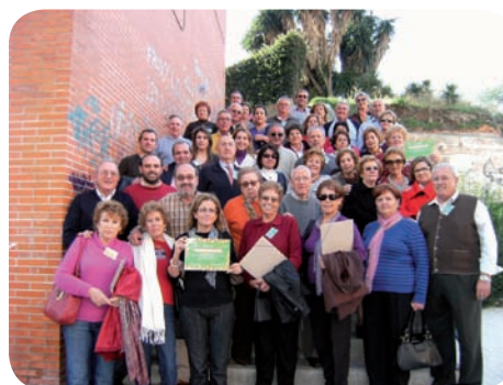
El voluntariado en Proyecto Hombre

en ellos, la necesidad de que sean sujetos activos de su propia existencia, que luchen contra su discriminación y encuentren el puesto que les corresponde en la sociedad. Por consiguiente, la relación que queremos crear entre la persona que ayuda y el ayudado, no parte de una supuesta superioridad del voluntario con respecto al beneficiario.