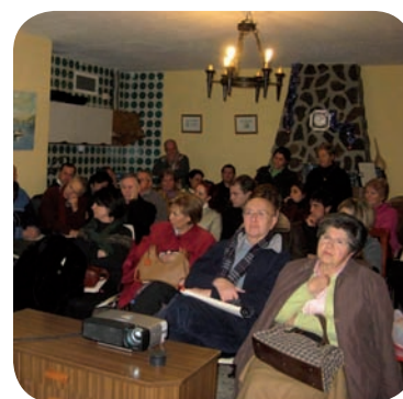
Jaracanda en Asamblea

da. De forma específica asumieron hasta febrero el costo de un terapeuta a media jornada que junto con otra de Proyecto Hombre, realizan el trabajo de prevención en centros escolares. Asimismo, a lo largo del año, han prestado su colaboración como voluntarios en todas las actividades de Proyecto Hombre y participado en la organización de eventos.